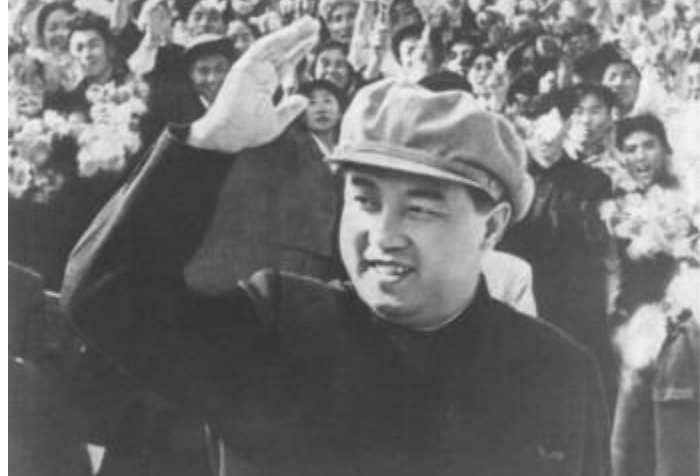
1948 год. Трудящиеся приветствуют товарища Ким Ир Сена

После освобождения Кореи от японских колонизаторов (15 августа 1945г.) на повестку дня нации встал вопрос о создании единого Корейского государства. В соответствии с ранее принятыми договоренностями после освобождения Кореи от японцев советские войска, принимавшие участие в освобождении Кореи, были выведены с её территории. В Северной Корее пришли к власти коммунисты. В конце зимы 1946 года был образован Временный народный комитет Северной Кореи. Председателем комитета стал Ким Ир Сен. Великий Вождь Товарищ Ким Ир Сен предпринимал огромные усилия для создания единого государства на освобожденной от японцев территории. Но это противоречило планам США, категорически не желавшим образования в Северо-Восточной Азии коммунистического форпоста.