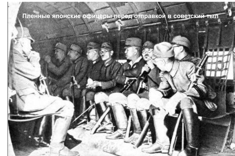
Пленные японские офицеры перед отправкой в советский тыл

Храня верность союзническому долгу, 8 августа 1945 года правительство СССР объявило Японии войну. На следующий день советские войска 1-го и 2-го Дальневосточных и Забайкальского фронтов, взаимодействуя с Тихоокеанским военно-морским флотом и Амурской речной флотилией, начали боевые действия на линии боевого соприкосновения протяженностью более 4 тысяч километров.