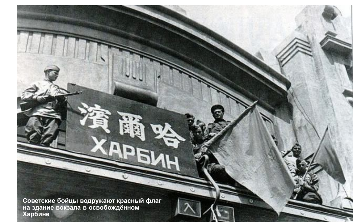
Советские бойцы водружают красный флаг на здании вокзала в освобожденном Харбине

10 августа в войну вступила Монгольская Народная Республика. Ее войсковые соединения действовали в составе Забайкальского фронта под командованием Маршала Советского Союза Р. Я. Малиновского. Совместное с монгольской Народно-революционной армией наступление развивалось успешно с первых же часов. Внезапность и сила первоначальных ударов позволили советским войскам сразу же захватить инициативу. В правительстве Японии начало военных операций Советским Союзом вызвало панику.