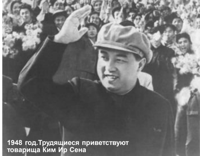
1948 год. Трудящиеся приветствуют товарища Ким Ир Сена

После освобождения Кореи от японских колонизаторов (15 августа 1945г.) на повестку дня нации встал вопрос о создании единого Корейского государства. В соответствии с ранее принятыми договоренностями после освобождения Кореи от японцев советские войска, принимавшие участие в освобождении Кореи, были выведены с её территории. В Северной Корее пришли к власти коммунисты. В конце зимы 1946 года был образован Временный народный комитет Северной Кореи. Председателем комитета стал Ким Ир Сен. Великий Вождь Товарищ Ким Ир Сен предпринимал огромные усилия для создания единого государства на освобожденной от японцев территории. Но это противоречило планам США, категорически не желавшим образования в Северо-Восточной Азии коммунистического форпоста.