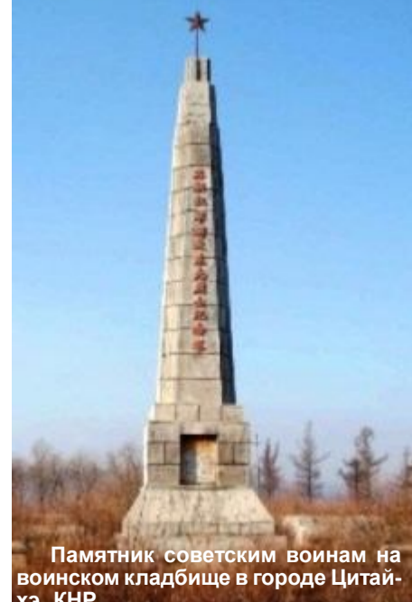
Памятник советским воинам на воинском кладбище в городе Цитаи-хэ, КНР

И.В. Сталин, выступая по радио, заявил: «Поражение русских войск в 1904 году в период русско-японской войны оставило в сознании народа тяжелые воспоминания. Оно легло на нашу страну чёрным пятном. Наш народ верил и знал, что наступит день, когда Япония будет разбита и пятно будет ликвидировано. Сорок лет ждали мы, люди старшего поколения, это дня. И вот, этот день наступил. Сегодня Япония признает себя побежденной и подписала акт безоговорочной капитуляции. Это значит, что Южный Сахалин и