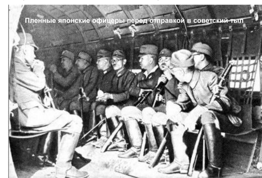
Пленные японские офицеры перед отправкой в советский тыл

Храня верность союзническому долгу, 8 августа 1945 года правительство СССР объявило Японии войну. На следующий день советские войска 1-го и 2-го Дальневосточных и Забайкальского фронтов, взаимодействуя с Тихоокеанским военно-морским флотом и Амурской речной флотилией, начали боевые действия на линии боевого соприкосновения протяженностью более 4 тысяч километров.