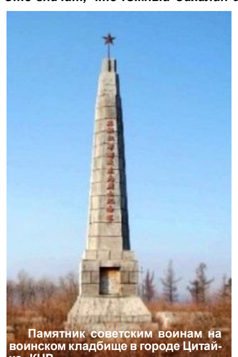
Памятник советским воинам на воинском кладбище в городе Цитаи-хэ, КНР

Курильские острова отойдут к Советскому Союзу и отныне они будут служить не средством отрыва Советского Союза от океана и базой японского нападения на наш Дальний Восток, а средством прямой связи Советского Союза с океаном и базой обороны нашей страны от японской агрессии. ...Наш советский народ не жалел сил и труда во имя победы. Мы пережили тяжелые годы. Но теперь каждый из нас может сказать: мы победили. Отныне мы можем считать нашу Отчизну избавленной от угрозы немецкого нашествия на западе и японского нашествия на востоке. Наступил долгожданный мир для народов всего мира».