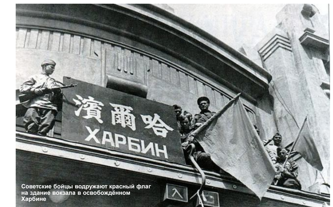
Советские бойцы водружают красный флаг на здании вокзала в освобожденном Харбине

10 августа в войну вступила Монгольская Народная Республика. Ее войсковые соединения действовали в составе Забайкальского фронта под командованием Маршала Советского Союза Р. Я. Малиновского. Совместное с монгольской Народно-революционной армией наступление развивалось успешно с первых же часов. Внезапность и сила первоначальных ударов позволили советским войскам сразу же захватить инициативу. В правительстве Японии начало военных операций Советским Союзом вызвало панику.