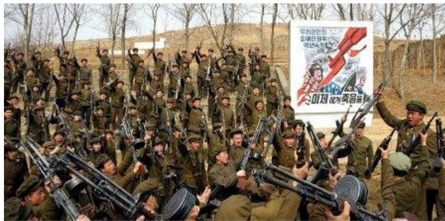
На фото: Рабоче-Крестьянское Красное Ополчение Пхеньяна. Из газеты "Нодон син-мун" за 16 марта 2013г.