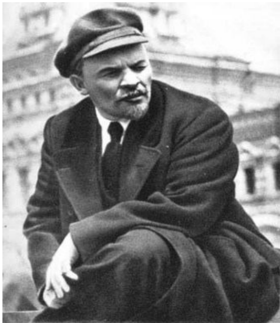
В. Маяковский, «Владимир Ильич Ленин» (фрагменты поэмы)

...Время, снова ленинские лозунги развихри! Нам ли растекаться слёзной лужею – Ленин и теперь живее всех живых, Наше знание – сила и оружие.