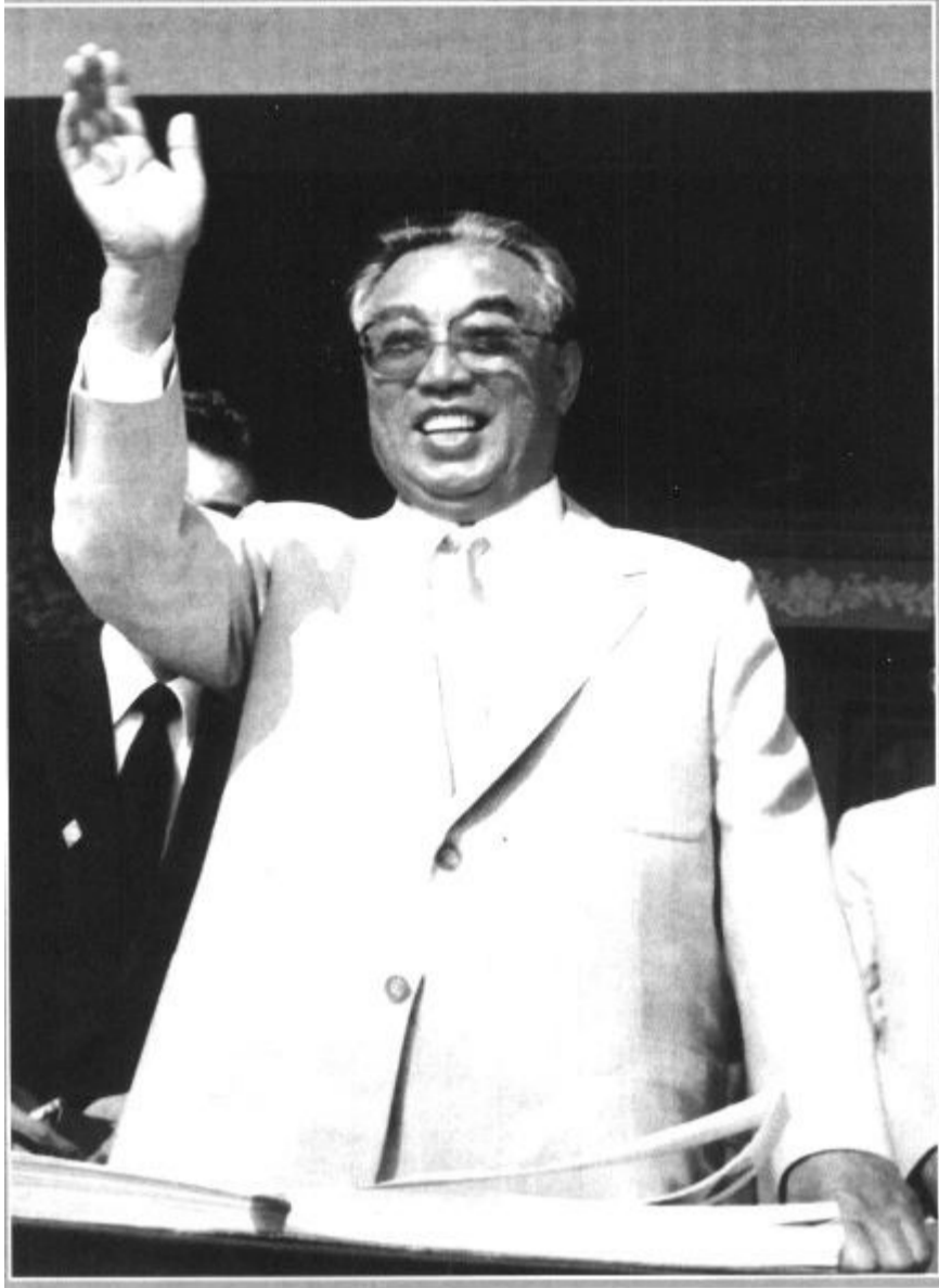
Президент Ким Ир Сен отвечает на горячие приветствия масс [сентябрь 77 года чухсе (1988)].

В КНДР в апреле отмечаются основные две знаменательные даты: – 15 апреля 101 годовщина со дня рождения товарища Ким Ир Сена, – 25 апреля основание товарищем Ким Ир Сеном Корейской Народной армии.