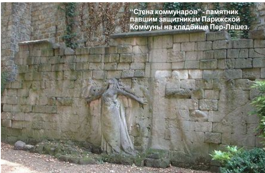
"Стена коммунаров" - памятник павшим защитникам Парижской Коммуны на кладбище Пер-Лашез.

В бой, коммунары, в бой под вихрями знамён! За батальоном батальон! Сегодня горизонт лучами озарён.