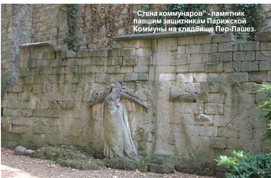
"Стена коммунаров" - памятник павшим защитникам Парижской Коммуны на кладбище Пер-Лашез.

В бой, коммунары, в бой под вихрями знамён! За батальоном батальон! Сегодня горизонт лучами озарён.